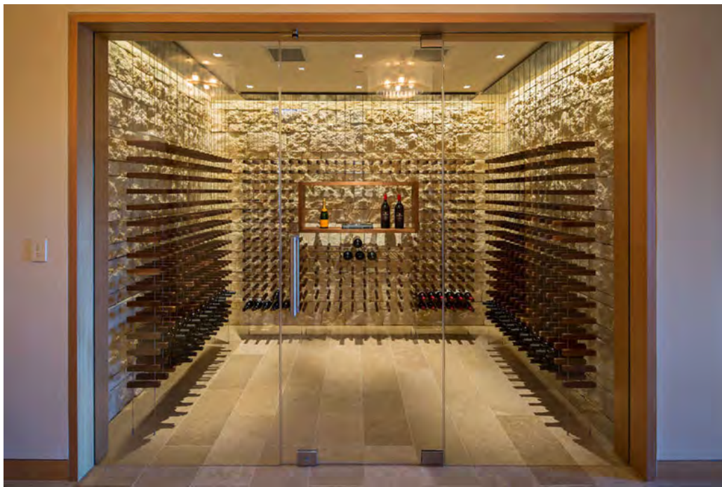
Foto: cantina climatizzata.

Degna di nota è anche la scelta della speciale maniglia con meccanismo a scomparsa, per un effetto di totale complanarità della porta.