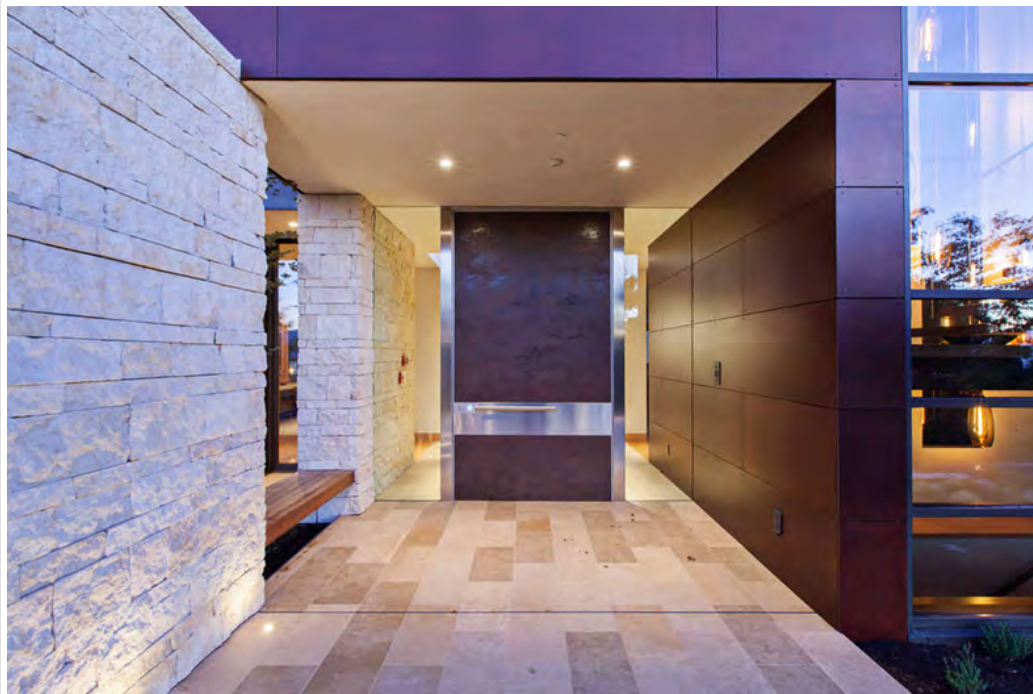
Foto : porta di ingresso Synua in Gres effetto cor-ten e doppio fianco luce.

L'imponente blindata è montata con doppio fianco luce per contribuire a conferire luce e spaziosità all'ambiente e creare un vero e proprio dialogo tra interno ed esterno, nonché continuità con le grandi vetrate laterali.