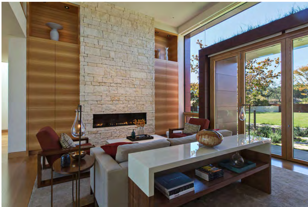
Foto: particolare salone interno con caminetto e ampie vetrate sul parco circostante