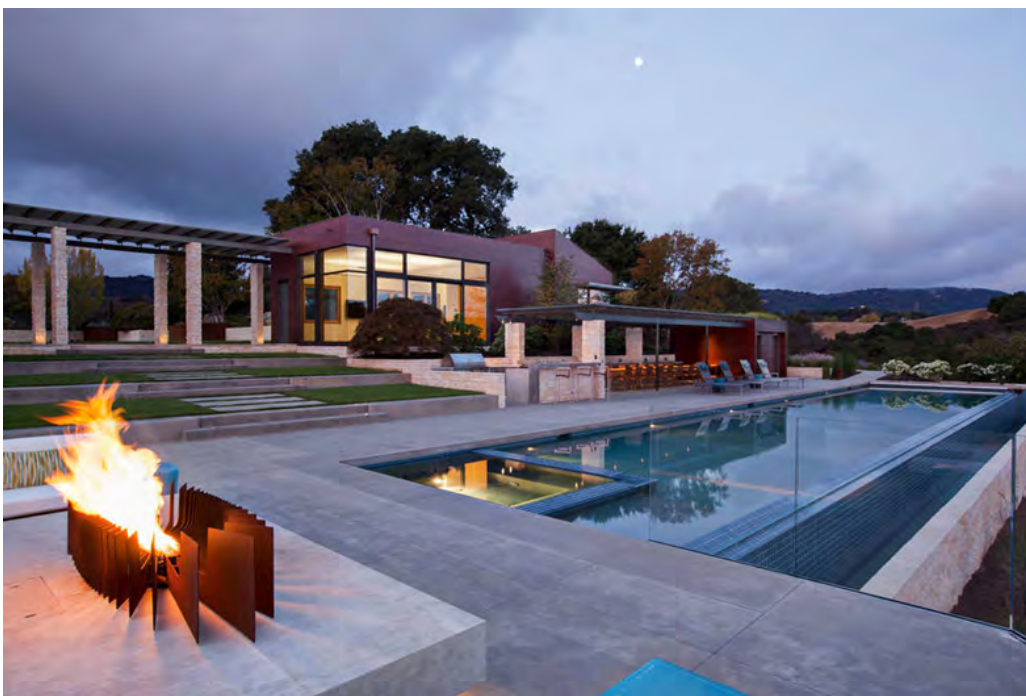
Foto: panorama con vista sulle colline di Cupertino